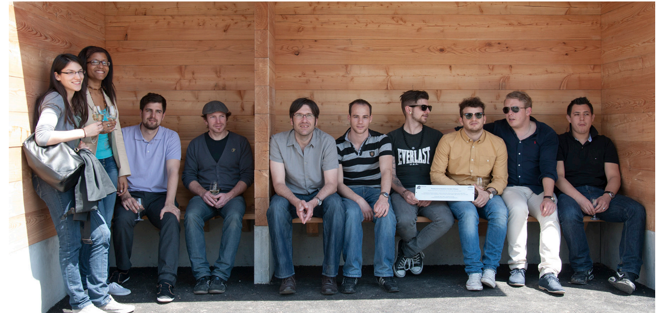
oben: Sitzprobe an der Aufrichte, Juni 2013 links: Explosionszeichnung der Konstruktion unten: Eckdetail im Appenzeller Strickbau